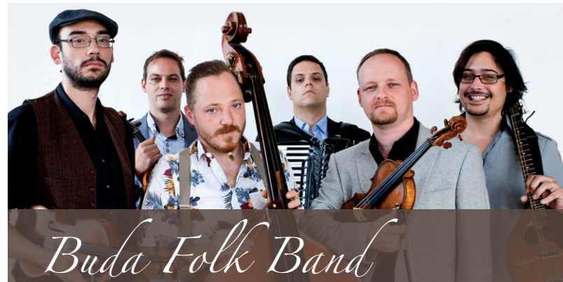
Buda Folk Band