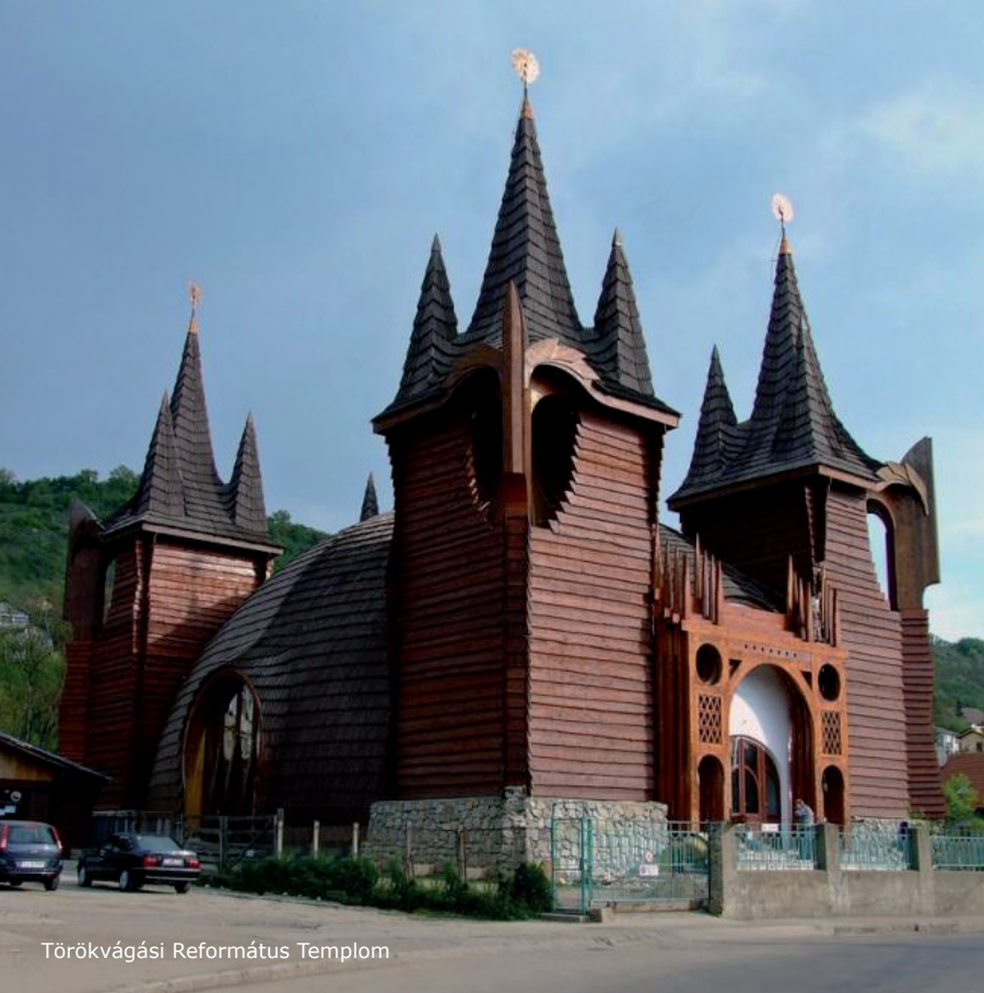
Törökvágási Református Templom